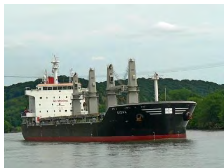
Slika 5. Brod Budva