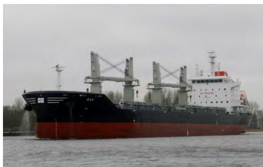
Slika 4. Brod Bar